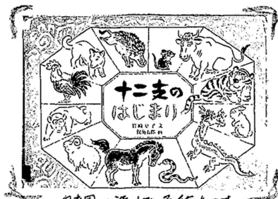
保育園で読んでいる絵本です

「わたしは何年？」と聞いてくる子どもたちに『十二支のはじまり』という絵本を読みました。御殿に着いた順で決まっていた事がわかり「生まれた年の干支があなたの干支だから猿だよ」と話すと「え～うさぎが良かったな～」と言っていました。こればかりはね～みなさんも子どもや親御さんの干支をはなしてみてください。もしかしたらその動物に見えてくるかも。その干支の特性を調べるのも面白いですよ。